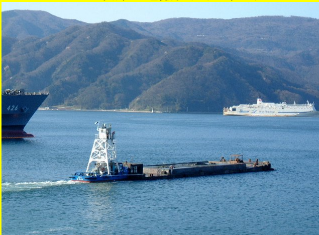
浚渫土運搬状況(日本丸)